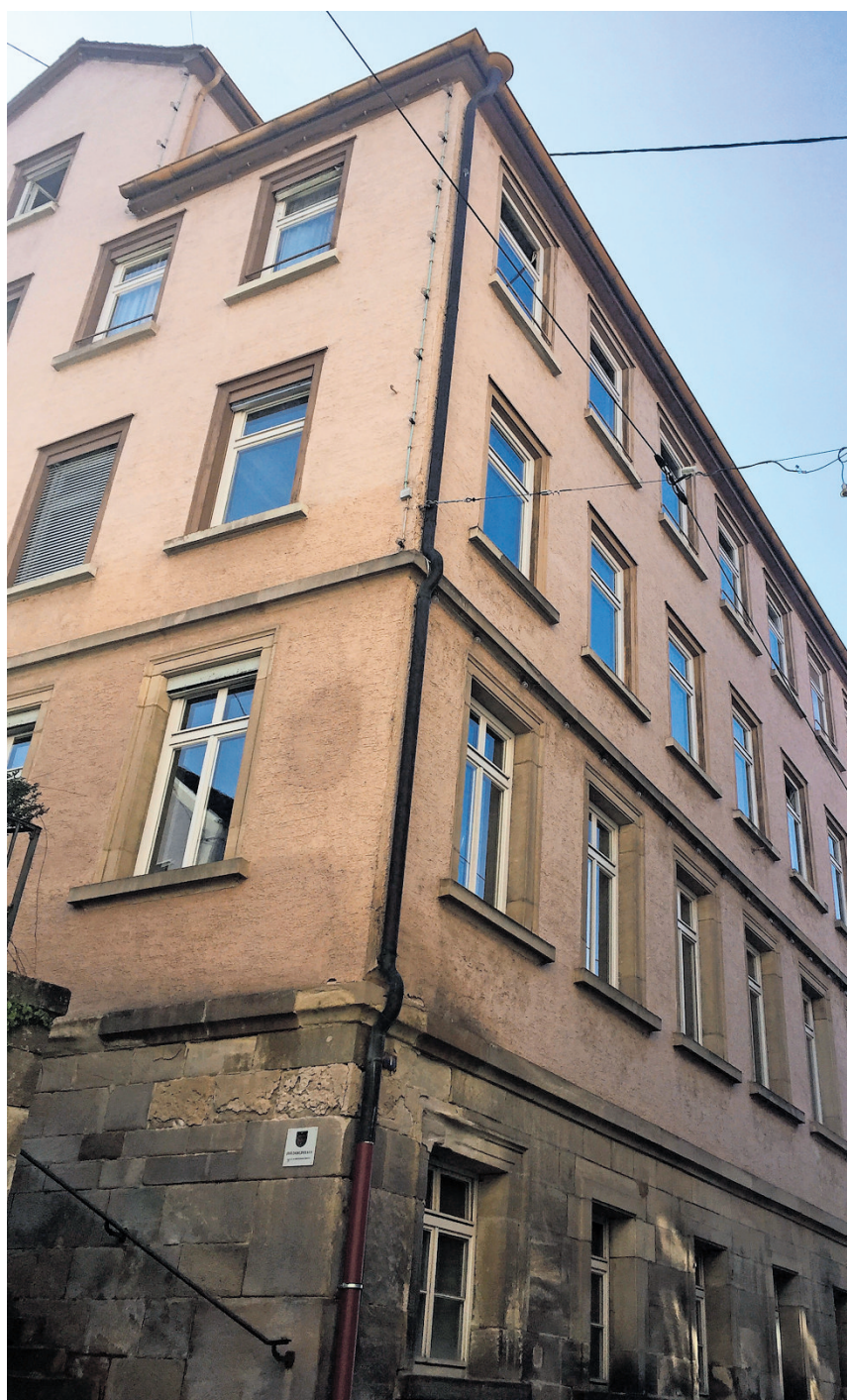
Kulturkleinod mit ungewisser Zukunft: das Nürtinger Hölderlinhaus.

Stattdessen fand laut Wirtschaftsministerium erneut eine „Begehung“ des Hauses statt. Danach müsse das Gebäude „in seinem heutigen Zustand als ein in mehreren Umgestaltungsphasen des 19. und frühen 20. Jahrhunderts entstandenes und nach dem Zweiten Weltkrieg ge-